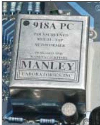
Uno dei due autotrasformatori disegnati e realizzati in proprio dalla Manley, responsabili in gran parte delle ottime prestazioni di questo apparecchio.

Vabbe', direte voi, abbiamo capito, ci hai messo un sacco di tempo per tarare 'sto pre, ma che ci frega? Vogliamo solo sapere se questo Steelhead va così bene come si dice in giro! Sì, vi rispondo, va così bene, e anche di più. Quantomeno con lo stadio MM (poi vedremo l'altro ingresso) credo di non aver mai sentito un analogico dal suono così dinamico, dal basso così potente, dall'immagine così ferma, plastica, insomma "analogica". La nettezza delle sfumature, la corposità che assumono è straordinaria, ed è vero quanto si legge nel manuale, ossia che alcuni dischi sembra di ascoltarli per la prima volta, anche se si pensava di conoscerli a memoria. Citerò solo alcuni dei moltissimi Lp che ho ascoltato per valutare questo stadio MM. Il primo è un Lp con due Concerti per pianoforte di Mozart (nn. 21 e 24) interpretati da Paul Badura-Skoda con l'orchestra da camera di Praga (un Supraphon dei primissimi '70, ottima incisione e straordinaria interpretazione del grande pianista viennese). Il pianoforte è tremendamente scolpito, ro-